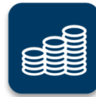
ECONOMIC & COMMUNITY DEVELOPMENT

Всички проекти, стипендианти и екипи за професионално обучение, финансирани от глобални грантове работят за постигането на специфични цели в една или повече от шестте сфери на фокус на Фондацията: