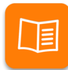
BASIC EDUCATION & LITERACY