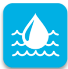
WATER & SANITATION