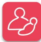
MATERNAL & CHILD HEALTH