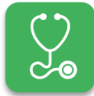
DISEASE PREVENTION & TREATMENT